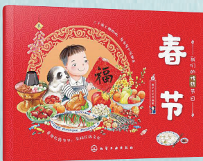
出版社：化学工业出版社 作者：稚子文化 定价：19.80元

内容介绍： 《我们的传统节日》系列图书收集了春节、元宵、清明、端午、中秋、重阳、腊八、灶王8个传统节日，都是孩子和家长感兴趣的传统节日。春节这个盛大的节日，我们要吃的美食数也数不清了！快和小主人公一起体验节日特色美食，一起听节日传说、背诗词与谚语，还有神奇的气节变化、历史典故、民俗知识、科普小知识等。语言简洁明快，情节引人入胜，大幅精美的图片，色彩鲜艳，适于儿童阅读。让孩子了解我们自己的传统节日，弘扬民族文化。