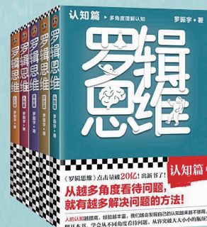
出版社：文汇出版社 作者：罗振宇 定价：199.50元

内容介绍： 精编757《逻辑思维》节目，5本新书多角度理解世界！人与人之间的差别就是认知。从越多角度看待问题，就能从越多角度认知世界，你就能发现事物的关联，看清世界的运转方式，把握事物的全貌和本质，就有越多解决问题的方法。罗振宇3年诚意之作！得到App官方授权！罗胖从一本好书、一个新现象、一件新鲜事中，分享思考新角度，不断刺激你学习。《认知篇》能让你保持头脑开放！《历史篇》能让你培养对未来的想象力！《商业篇》能让你了解商业的底层逻辑！《人物篇》能让你感受历史人物的智慧！《人文篇》能让你发现身边的美好！它不是答案，而是通向答案的钥匙之一。一旦学会从不同角度理解事物，你就能拓宽认知的边界，保持头脑开放，应对未来的不确定性，解决令人束手无策的人生难题！