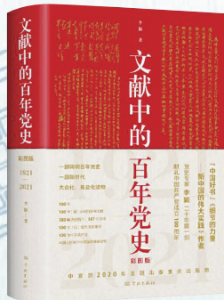
出版社：学林出版社 作者：李颖 定价：168.00元

内容介绍： 一个政党、一个国家、一个民族，都有为之奋斗的梦想。要实现梦想，就要有信念、有道路。信念指引道路，道路通往梦想。回望历史，对马克思主义的信仰，对社会主义和共产主义的信念，始终是中国共产党人的政治灵魂，是中国共产党人经受风险和考验的精神支柱，也是中国共产党带领人民探索适合中国国情的革命建设改革道路，从小到大、由弱到强，从胜利走向新的胜利的根基所在。本书为“中国好书”《细节的力量：新中国的伟大实践》作者二十年磨一剑之作，“四史”学习推荐读物。本书依据“几代中国共产党人智慧的结晶”的党的重要文献，每年以一件（组）珍稀文献（包括图片）为引，100年选取100个（组）重大事件，全面反映党的不懈奋斗史、理论探索史和自身建设史，着重讲述时代英雄和普通人物的感人故事，点面结合，串联起中国共产党100年奋斗历程，构成一部简明百年党史。