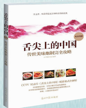
出版社：光明日报出版社 作者：舌尖上的中国节目组 定价：29.80元

内容介绍： 以纪录片《舌尖上的中国》为缘起，纪录片配套菜谱《舌尖上的中国：传世美味炮制完全攻略》一书，淡化了复杂的技法、炫目的配料、精致的器皿，强调食物天然的质地和味道之美，以大量微距镜头拍摄食物，充分展现了食物本身的质感，让您用手就能触到食物呼之欲出的美味。本书打破了原纪录片7集的结构，以菜式为核心，分为5章，将我们关于山珍海味、花样主食、豆奶制品、腌货腊味和五味调和的美好记忆与制作方法——道来，与您分享。