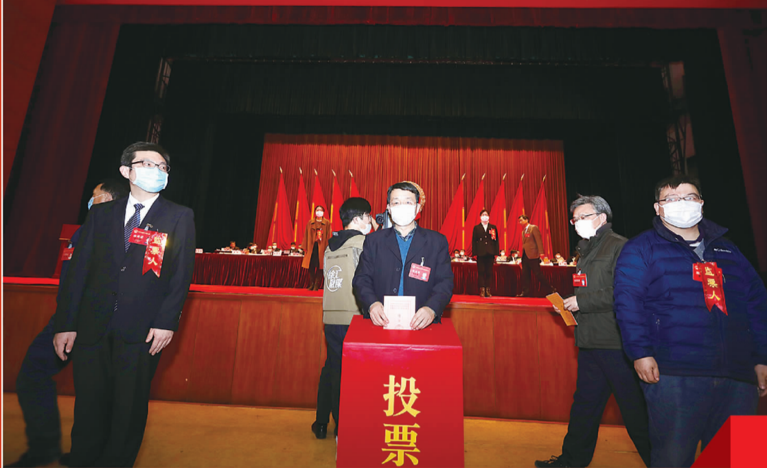
上海市徐汇区第十六届人民代表大会第七次会议