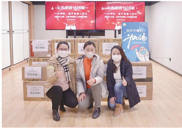
2020年2月，为武汉捐赠抗疫物资

五年来，台盟徐汇区委着眼参政党自身特色，紧扣“五一口号”发布70周年、《告台湾同胞书》发布40周年等重要节点，组织各类形式多样的主题教育活动，开展盟员“分类带教”队伍建设工作。通过参访台湾光复纪念碑等爱国主义基地，开展学盟章读盟史等专题活动，强化初心意识，夯实政治认同。通过开展学唱闽南歌、“台湾茶文化”等专题活动，打造“乡情”品牌活动，深化盟员乡情意识。通过组织青年盟员上门拜访老