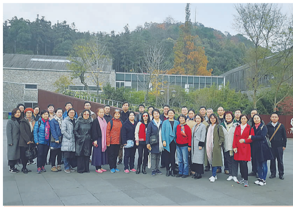
2018年11月，参观九三学社创始人梁希纪念馆，重温初心使命

五年来，九三学社徐汇区委始终不忘合作初心、继承优良传统、勇担时代使命，按照习近平总书记“四新”“三好”的要求开展好各项履职尽责工作。始终坚持人才强社战略，注重高质量队伍建设，聚焦科技研发、科技创新领域发现吸纳优秀中青年人才，多渠道搭建平台加强后备干部队伍建设，并夯实基层支社建设，建立健全机关工作机制，强化对骨干社员的教育培养和使用管理，在新起点上实现组织工作新