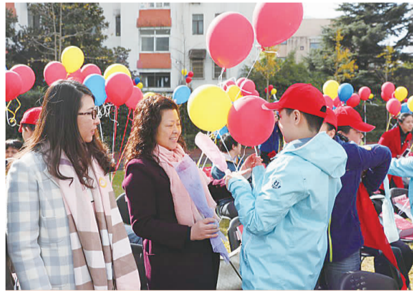
2016年12月，与董李凤美康健学校师生共迎新春

近年来，荣获台盟中央2019年度市级组织参政议政突出贡献奖，连续五年荣获台盟中央地市级参政议政先进集体，连续五年荣获台盟市委参政议政先进集体等。