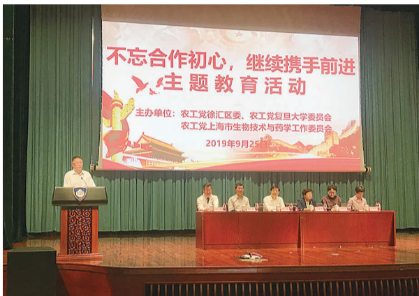
2019年9月，联合农工党复旦大学委员会、农工党上海市生物技术与药学工作委员会共同举办“不忘合作初心，继续携手前进”主题教育活动

写新篇章”“幸福徐汇、健康家园”等主题论坛，坚持学理论、议大事、谋全局、出思路，积极倡导开放式、互动式、研究式、共享式、启发式学习，充分发挥引领和示范作用，不断推动理论研究成果的转化和应用。2016年成立“‘同向汇’农工党徐汇区委凌云街道工作室”，打通联系、服务群众“最后一公里”，成为社情民意收集点、党外干部实践锻炼点、基层协商民主议事点和基层社会治理服务点。深入社区开展“社区行”系列活动，践行基层协商民主，先后走进梅陇六村、梅陇九村、食品商店、阳光之家、居民家庭等，开展小区综合治理、食品安全、河道治理、残障人士保护等专项调研活动，听民情、解民忧，反映群众呼