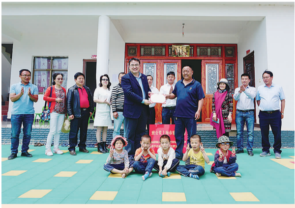
2019年5月，向漾濞县富恒乡石竹村幼儿园捐赠教学设施设备购置经费34980元

社情民意及课题调研工作。五年来，共报送社情民意645篇，其中200多篇被市级以上部门录用，10余篇获市级领导批示。秉持致力为公宗旨，积极开展社会服务。响应致公党中央号召，携手致公党大理市委联合开展云南省漾濞县富恒乡石竹村结对帮扶工作，实现脱贫摘帽。五年来，通过产业扶贫，协助成立“致公爱心采买生态产品展示中心”和“互联网精准扶贫办公室”；通过消费扶贫，制订“致福采买”计划，走进星空卫视明星互动扶贫节目《远山深处的美食》向观众推介漾濞核桃，广泛动员全体党员采购贫困户核桃达33.6万余元；通过教育扶贫，向对口帮扶地区捐赠97239元，用于开展“致公山区春蕾工程”，改善当地