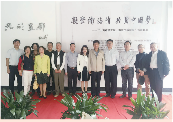
2016年10月，主办“凝聚侨海情，共圆中国梦”书画联展

地教育教学环境。2019年，在康健街道设立“同向汇”致公党徐汇区委基层服务点，深化基层服务，坚持每年组织学雷锋便民服务、敬老慰问等，并组织爱心义卖及捐款，共计筹得166022元。发挥侨海报国党派特点，多次接待来自南非、意大利、西班牙、澳大利亚、德国等海外侨团嘉宾及我国台湾地区访问人士，陪同调研我区为侨服务工作，向海外侨胞传播中国声音、讲好中国故事。近年来，2016年被致公党中央选为第一批参政议政联系点，荣获致公党中央社会服务工作、参政议政工作先进集体，荣获致公党市委2019年度社会服务工作先进集体，并连续多年荣获致公党市委社情民意先进集体。