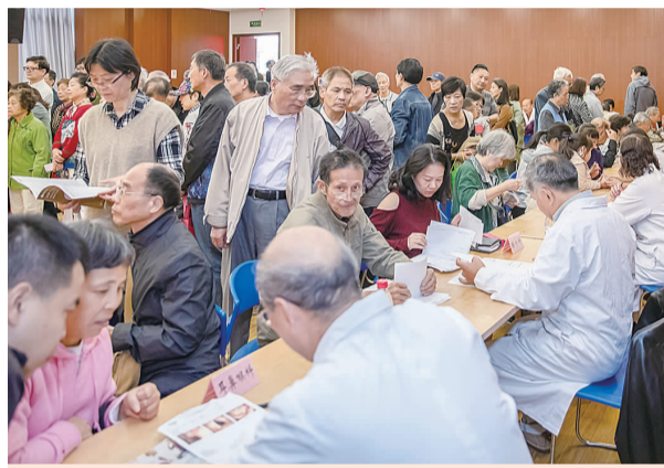
2018年10月，举办庆重阳进社区大型医疗咨询活动

坚持深度调研摸实情，精准把脉出实招。20多个调研课题转化为市、区政协大会口头发言、书面发言、集体提案等，围绕黄浦江45公里岸线贯通、精准扶贫合规性操作、设立“国家卫生防疫日”、防范城市地面沉降、水源地水质安全保