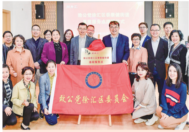
2019年10月，致公党区委康健街道基层服务点揭牌

五年来，致公党徐汇区委注重思想政治建设，锤炼党员政治品质，筑牢理想信念根基。紧扣形势发展需要及侨海特色定位，优化规范组织建设，实施人才兴党战略，积极稳妥做好组织发展工作。2017年成立科技创新委员会；2018年成立监督委员会，将党内监督落到实处；2019年成立以青年海归为主力军的基层支部，加强思想引领和团结凝聚。紧扣参政三大基本职能，积极围绕中心，服务大局，切实善议政、会协商，做好