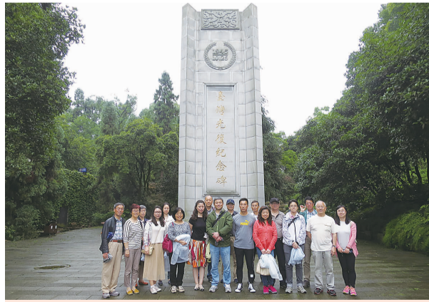
2016年5月，组织盟员赴重庆参观台湾光复纪念碑

围绕徐汇中心工作，着眼区域经济社会发展中的重大问题和群众普遍关心的热点问题，以课题调研和社情民意支为点，协商议政为中心，推动参政议政工作稳步开展。五年来，共报送社情民意516篇，其中100余篇被市级及以上部门录用，6篇获市级领导批示，2篇获中央领导批示。