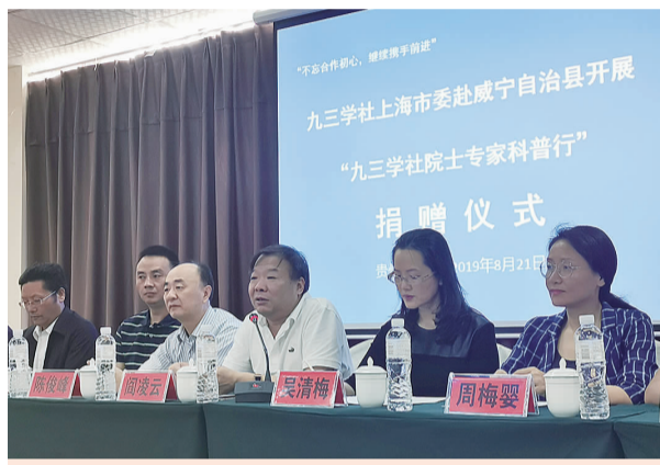
2019年8月，向贵州威宁捐赠总价值4.5万元诊疗设备

近年来，荣获九三学社中央2016-2020年度社会服务先进集体，九三学社市委参政议政先进个人一等奖、九三学社市委新闻宣传和信息工作先进集体一等奖等。