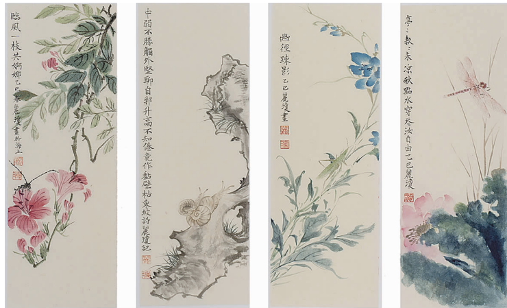
国画《岁华幽赏·二十四景》局部

草稿箱里有2件,哦,那是没来得及发的。 啥时候开设的我的邮箱?你还记得吗? 我记得以前每天都要和你见面,都要麻烦你发稿件、照片以及报纸的PTF小样等等,你辛苦啦,谢谢! 忘记从什么时候开始,我从手机从微信上发稿件发照片发东东了。 据查,2011年5月微信首次支持照片可以发送; 次年4月手机里新增文件传输助手可以发文件。