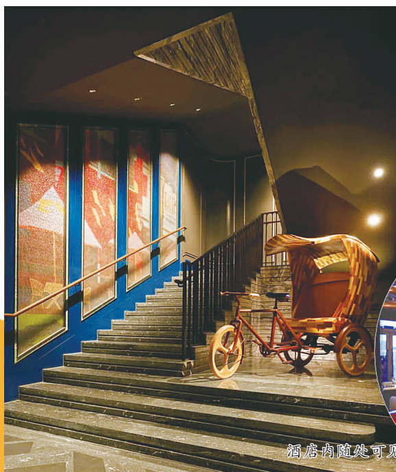
酒店内随处可见的上海元素