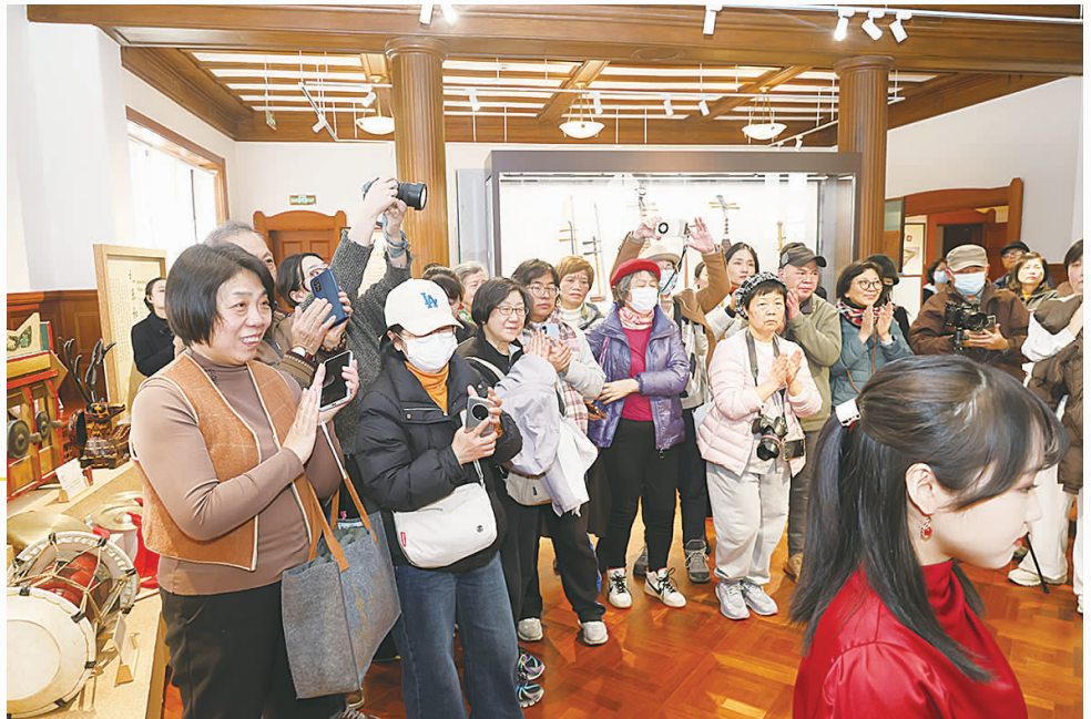
市民为精彩的表演鼓掌

现场不少听众都是慕名而来,很多还是徐汇区新时代文明实践“文明夜课”的粉丝,从文明夜课的音乐思政课到此次的午间音乐美育暨音乐思政课,从未停止关注。今后,音乐街区里的午间美育课暨博物馆里的音乐思政课,每周将在此奏响各具特色的乐器,让听众们在文物与乐声中感悟家国情怀、传承文化根脉。