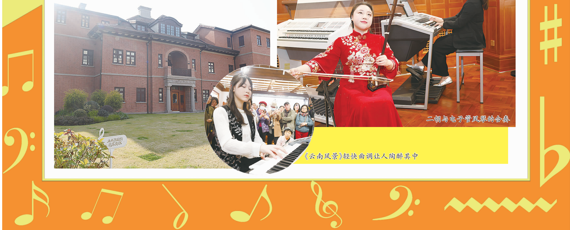
《云南风景》轻快曲调让人陶醉其中