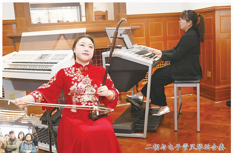
二胡与电子管风琴的合奏