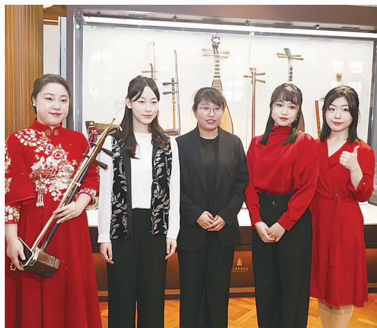
参加演出的师生合影留念