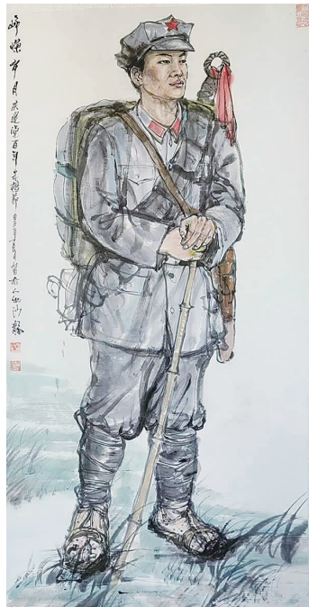
▲ 国画《峥嵘岁月》 ▲ 国画《徐家汇遛娃的宝地》

2008年,舅舅被查出癌症,消息如巨石般压在整个家族心头。我的外婆育有四兄妹:舅舅、大姨、我的妈妈和小姨,四人从小相依为命,手足情深。我妈妈是灵魂人物,热心担当,家里无论大小事,她总会倾尽全力。也正是在那一年,妈妈召集全家族召开了一次重要的家庭会议。她看着病痛中的舅舅,哽咽着说,希望在他有生之年,能天天开心,家庭和美。于是,我们一起做了个郑重决定:从2009年除夕至年初三,全都聚到舅舅家,热热闹闹过大年。