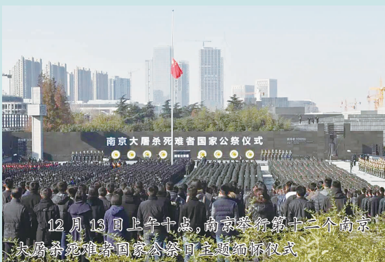
12 月 13 日上午十点,南京举行第十二个南京大屠杀死难者国家公祭日主题缅怀仪式

四行仓库祭奠民族英雄谢晋元。观看 12 月 13 日公祭仪式后,姜翰程表示:“今年是南京大屠杀 88 周年。结合最近的新闻报道,我们要警惕日本军国主义抬头。我还看到有记者在韩国首尔街头做二战历史题材访问,当地年轻人中知道南京大屠杀的人不多,但看到相关介绍后,无不义愤填膺。每年的国家公祭日,不仅仅是让我们勿忘国耻,更是鼓励我们青少年,乃至更多中国人,要自强!”