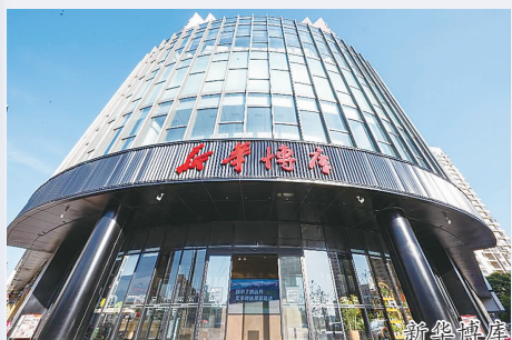
GATE M 西岸梦中心—船坞码头

近期,上海市文化旅游局开展了第六批上海市民“家门口的好去处”遴选工作,经专家现场评定及市民投票,确定了第六批50家体现文旅融合、品质人气的上海市民“家门口的好去处”。徐汇区有7处入选,从时尚潮流的滨江舞台到古今交融的音乐空间,这些藏着惊喜与故事的文旅地标,正等你来解锁属于徐汇的幸福体验!