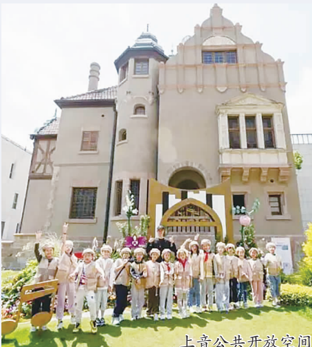
上音公共开放空间