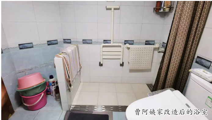
曹阿姨家改造后的浴室