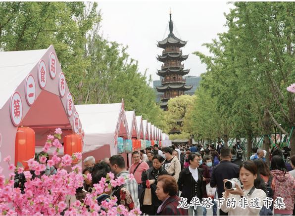
龙华广场下的非遗市集

在徐家汇书院一楼中庭,由 3D 打印技术再创作的“光启之门”无疑是最耀眼存在,它细腻的纹路还原着百年土山湾牌楼的古朴肌理,光影流转间,仿佛能触碰到中西文化交融的历史温度。这座得名于“中西文化会通第一人”徐光启的书院,从诞生之日起就扛起了文脉传承的使命,而这座