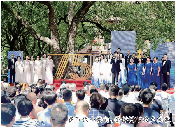
在百代小楼前,奇谭剧市放声高歌

当书院的灯光与滨江的星光交相辉映,当老建筑的肌理与新场馆的线条完美融合,徐汇正用实际行动诠释:文化不是陈列在橱窗里的展品,而是浸润在生活里的暖意;不是尘封在典籍中的文字,而是每个人心中的光。从一座书院的微光,到公共文化的璀璨,徐汇用“人民对美好生活的向往”为笔,在“十四五”的画卷上,写下了最温暖的答案。