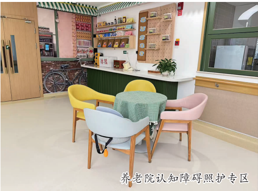
养老院认知障碍照护专区

时排除了火情。烟雾报警器、睡眠监测、红外报警等智能设备,如今都能在居委会申请,让科技成为老人居家的“隐形守护者”。