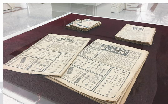
蚂蚁出版社的相关书籍