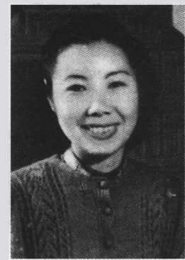
关露,电影《十字街头》主题曲《春天里》词作者